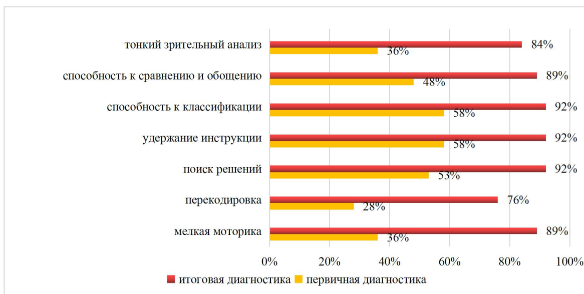
Диаграмма 2. Динамика формирования психологической готовности к школе

Мониторинг качества освоения обучающимися основной образовательной программы показал, что 86% обучающихся успешно освоили образовательную программу дошкольного образования в своей возрастной группе, большинство из них (67,2%) освоили программу на достаточно высоком уровне (4,5 уровни).